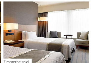
Keio Plaza Hotel