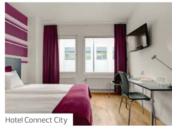
Hotel Connect City